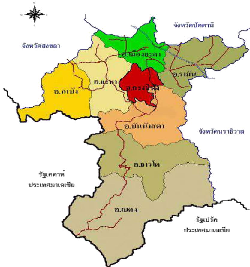
ภาพที่ ๑ แสดงที่ตั้งและอาณาเขตของจังหวัดยะลา